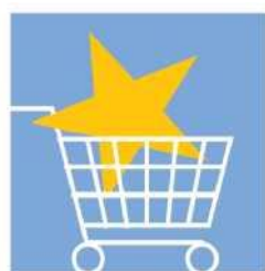
Интереси на потребителите