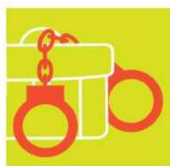
Борба с подкупите, искане на подкуп и изнудване