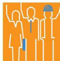
Заетост и Индустриални отношения