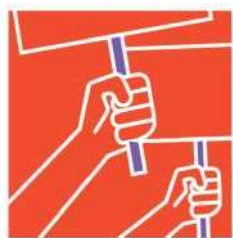
Права на човека

Надлежната проверка има за цел да се справи с нежелани въздействия, свързани със следните глави от Насоките на ОИСР за многонационалните предприятия: